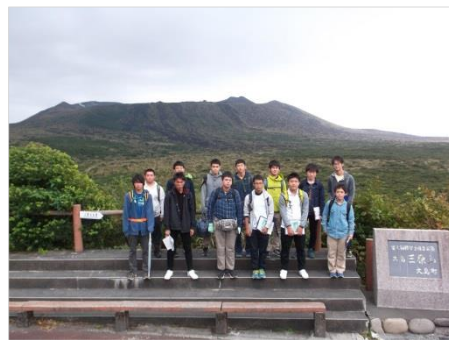
希望参加の様々なプロジェクトが企画されます。写真は社会と理科のコラボで伊豆大島・三原火山の見学に行き、火山と植生、防災などの関係を調査しました。