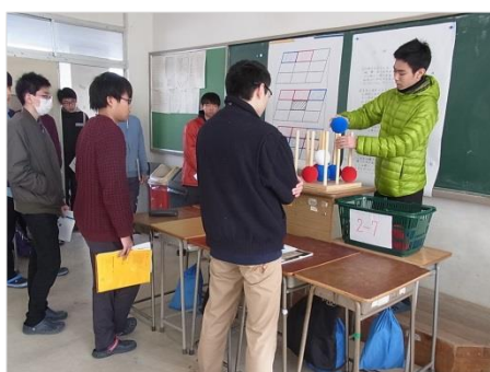
熊高ゼミは、1、2年次の全員の生徒が各自のテーマに沿って研究を進め、2月に発表します。約30のテーマに分かれて研究を行いました。